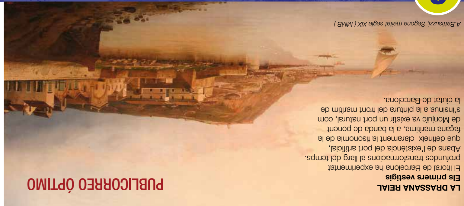
A. Battistuzzi, Segona meitat segle XIX (MMB)

LA DRASSANA REIAL Els primers vestíglis El litoral de Barcelona ha experimentat profundes transformacions al llarg del temps. Abans de l'existència del port artificial, que defineix clarament la fisonomia de la façana marítima, a la banda de ponent de Monjuïc va existir un port natural, com s'insinua a la pintura del front marítim de la ciutat de Barcelona.